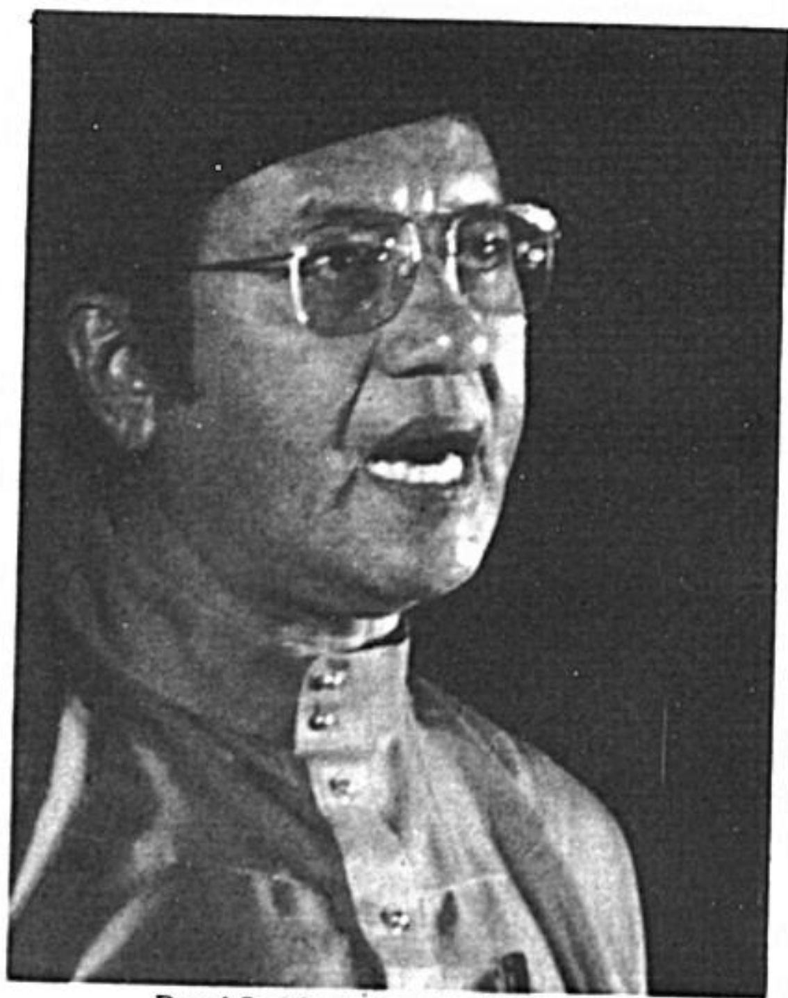
Dato' Seri Dr. Mahathir Mohamad