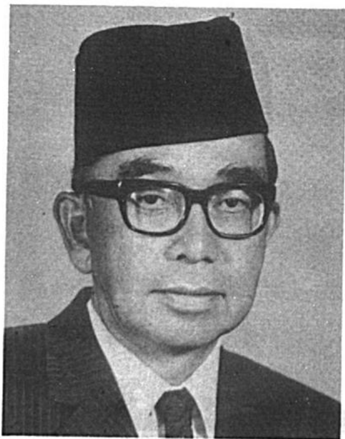
Allahyarham Tun Razak