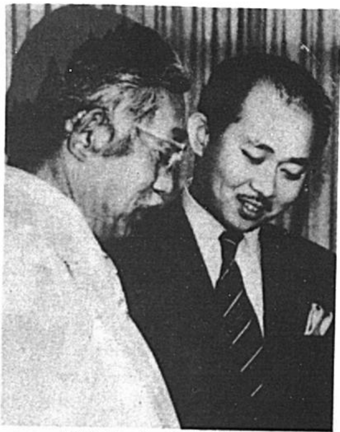
Allahyarham Tun Dr. Ismail bersama Tengku Razaleigh Hamzah