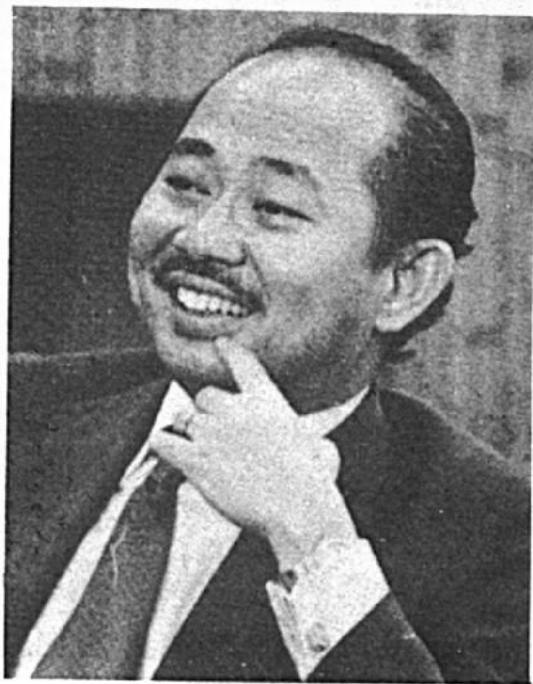
Tengku Razaleigh Hamzah