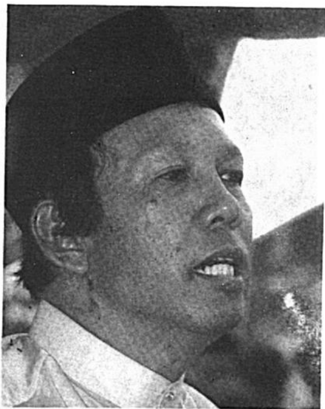
Dato' Musa Hitam