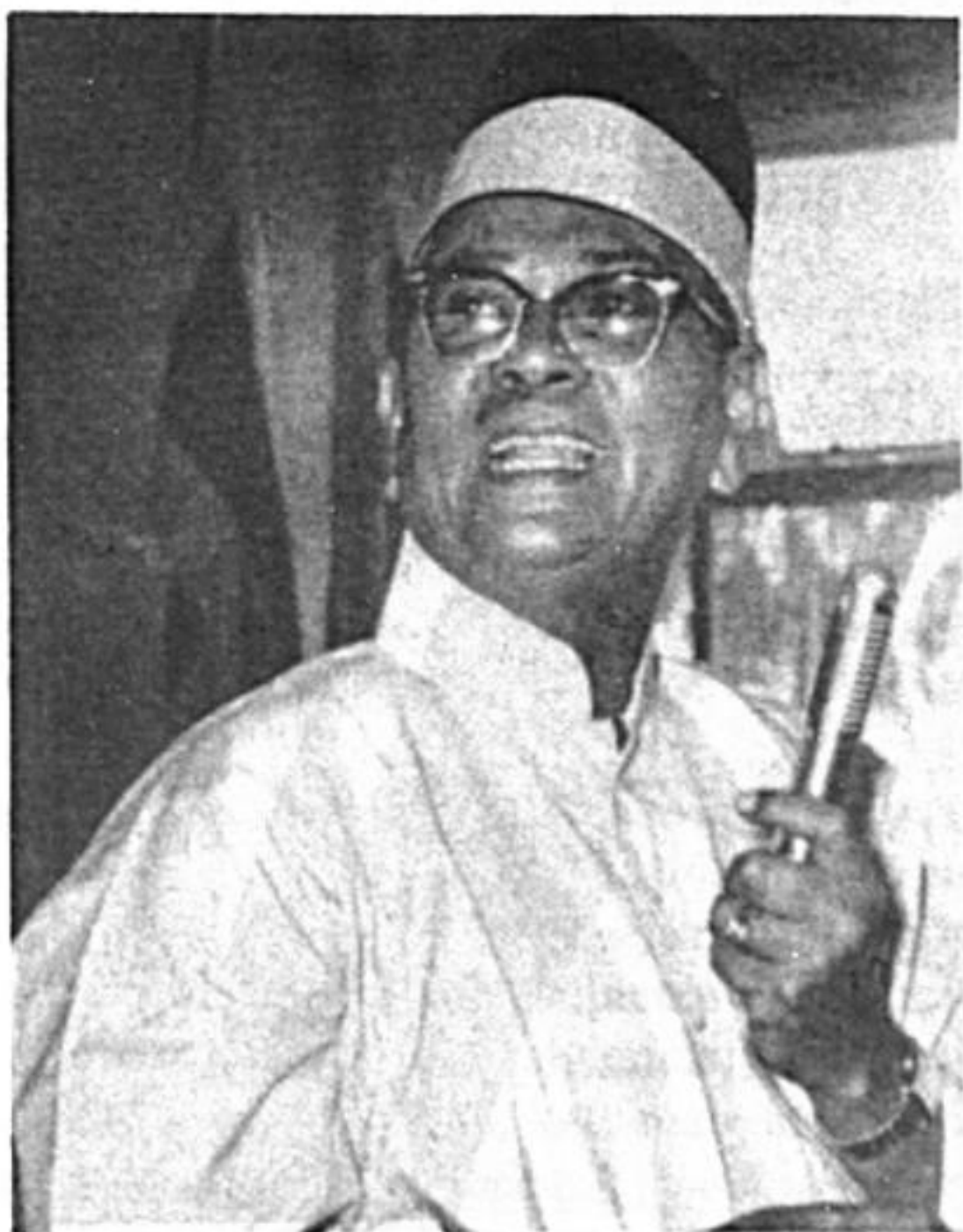
Tengku Abdul Rahman